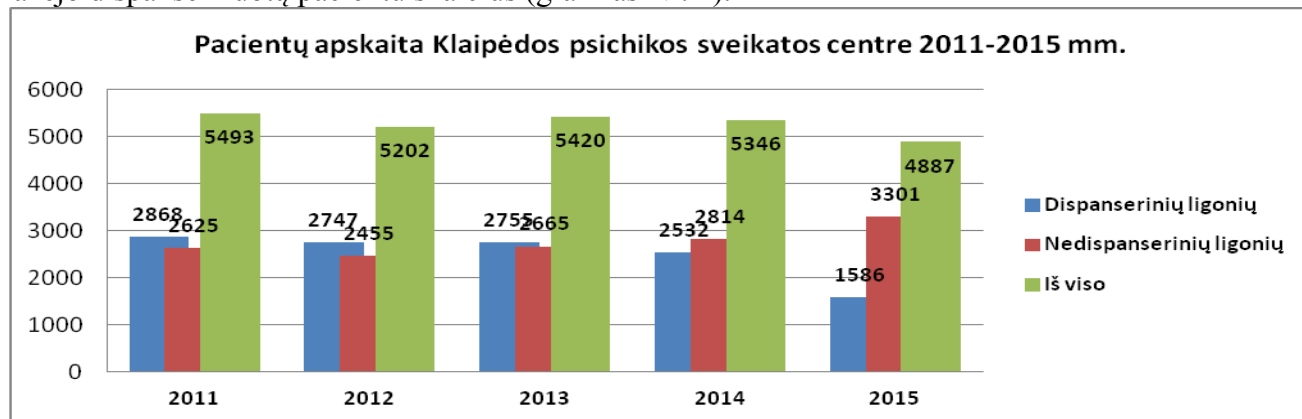
Grafikas Nr. 2

Kiek išaugo vaikų apsilankymų skaičius KPSC, lyginant su 2014 metais (grafikas Nr. 1). 2015 m. sumažėjo dispanserizuotų pacientu skaičius (grafikas Nr. 2).